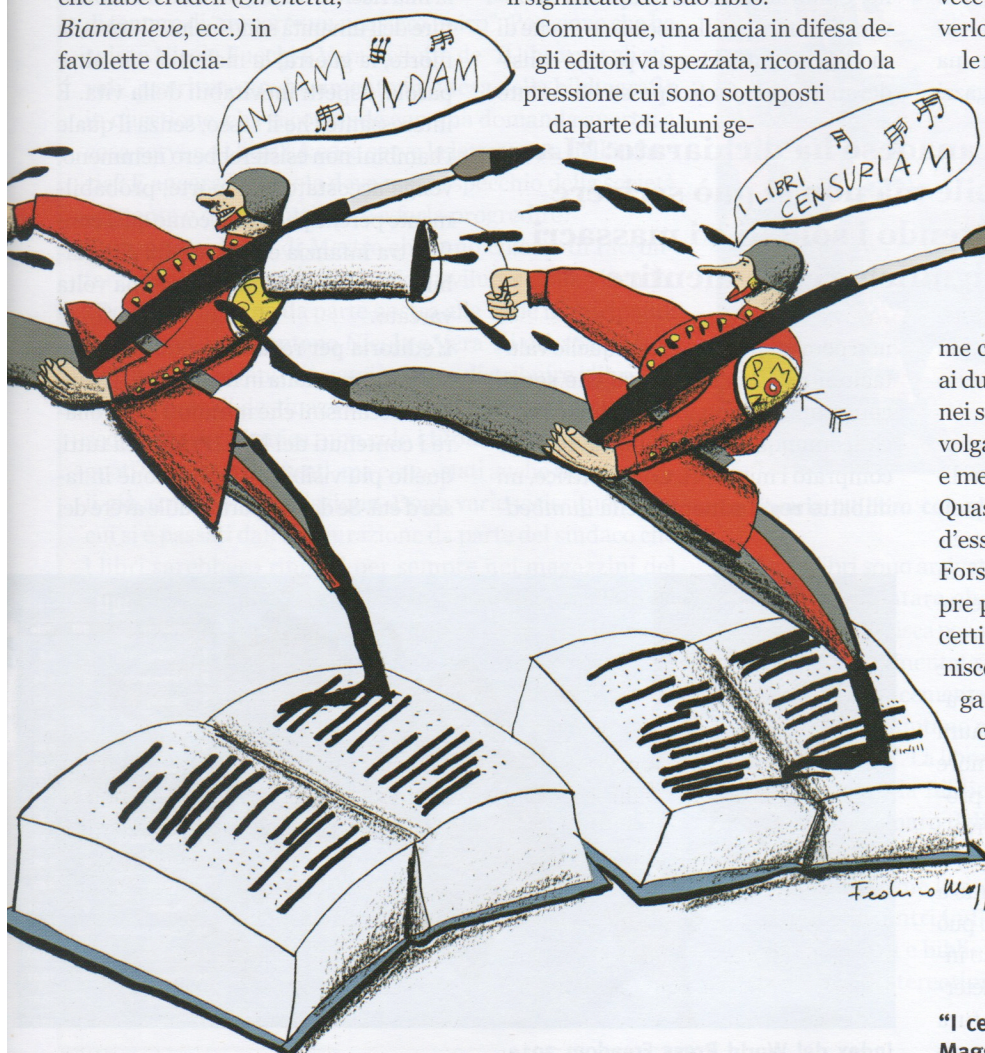
→ NOMP: NUCLEO OPERATIVO DI PERSUASIONE MORALE

Eppure, e questa è la cosa che più mi colpisce, non sembra che le medesime censure preventive siano applicate ai due strumenti tramite i quali la realtà nei suoi aspetti più deleteri e spesso più volgari assale quotidianamente giovani e meno giovani: televisione e internet. Quasi che i “ragazzi” abbiano bisogno d’essere protetti solo quando leggono. Forse perché, anche in quest’era sempre più digitalizzata, i pensieri e i concetti assimilati attraverso la lettura finiscono per avere un effetto di gran lunga più profondo del bombardamento continuo di immagini e notizie spesso contraddittorie. O forse è proprio vero che, almeno per quanto riguarda i seguaci di un perbenismo vagamente ipocrita, sono ancora e sempre i libri, le parole stampate, a fare paura.